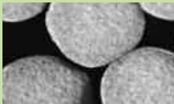
ΟΞΙΚΗ ΚΥΤΤΑΡΙΝΗ - Ενεργός άνθρακας Φίλτρο micronite

λαυση. Το ίδιο λυσιτελής υπήρξε και η λύση της ενσωμάτωσης σωματιδίων ενεργού άνθρακα στα φίλτρα.