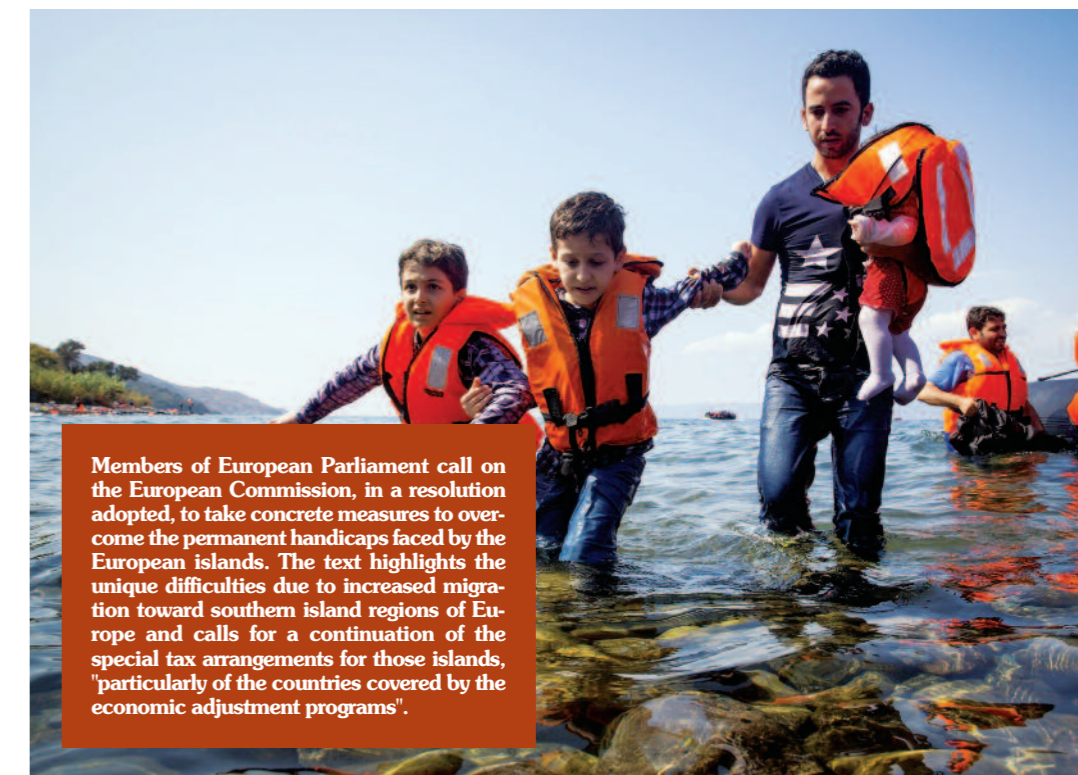
Members of European Parliament call on the European Commission, in a resolution adopted, to take concrete measures to overcome the permanent handicaps faced by the European islands. The text highlights the unique difficulties due to increased migration toward southern island regions of Europe and calls for a continuation of the special tax arrangements for those islands, "particularly of the countries covered by the economic adjustment programs".

Οι νότιες περιοχές και τα νησιά της Μεσογείου είναι ιδιαίτερα εκτεθειμένα στις αυξανόμενες μεταναστευτικές ροές. Οι ευρωβουλευτές ζητούν να υπάρξει μια πανευρωπαϊκή προσέγγιση "που θα πρέπει να περιλαμβάνει αφενός στήριξη από την ίδια την ΕΕ και αφετέρου μια κοινή προσπάθεια από όλα τα κράτη μέλη".