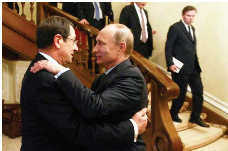
Θερμή υποδοχή από τον πρόεδρο Πούτιν είχε ο πρόεδρος Αναστασιάδης στη Μόσχα

Στην Κύπρο υπενθυμίζει η Deutsche Welle (στην ιστοσελίδα της στα αγγλικά), υπάρχουν επίσης στρατιωτικές βάσεις της