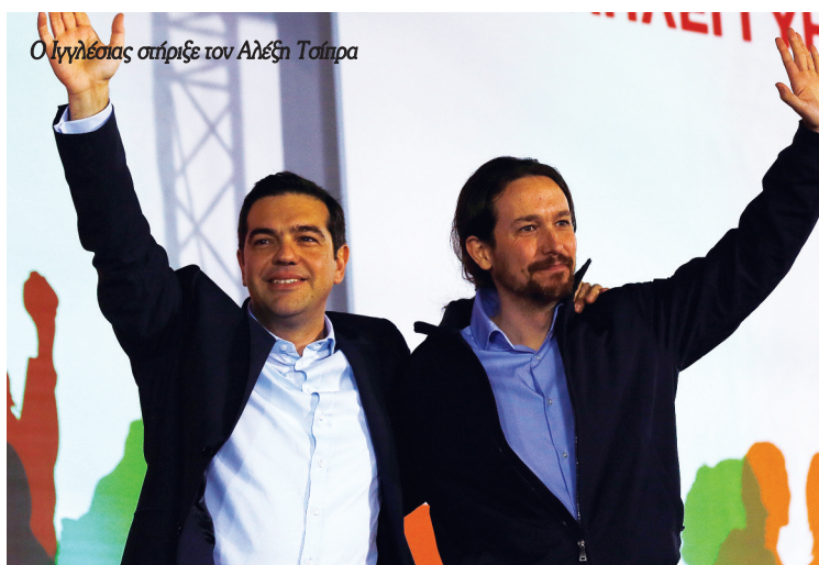
Ο Ιγγλέσιος στήριξε τον Αλέξη Τσίπρα

Η οικογένεια αυτή απειλείται να πεταχτεί στο δρόμο, επειδή αδυνατεί να πληρώσει τις δόσεις του τραπεζικού δανείου. Ο Ροντριγκέθ και οι σύντροφοί