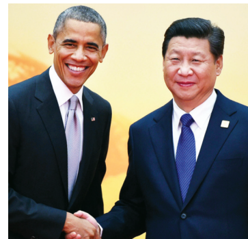
Ομπάμα – Σι Τζιν Πινγκ

την Οικονομική Συνεργασία Ασίας-Ειρηνικού (APEC) στο Πεκίνο, έγιναν σειρά σημαντικών συναντήσεων από τους ηγέτες των χωρών που συμμετείχαν σ' αυτήν.