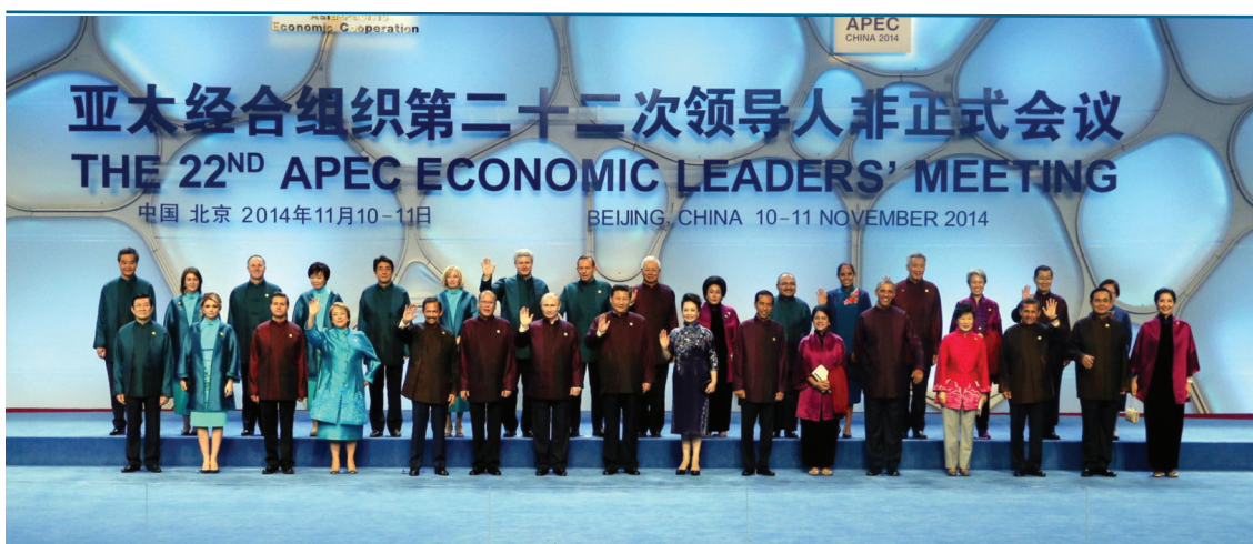
Η οικογενειακή φωτογραφία των ηγετών που πήραν μέρος στην APEC