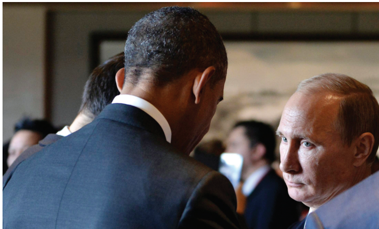
Ομπάμα - Πούτιν: Τα είπαν στα όρθια

λαγή, τον επόμενο χρόνο στο Παρίσι, θα καταλήξουν σε συμφωνία». Με τον αμερικανό πρόεδρο Μπαράκ Ομπάμα συνομίλησε και ο Βλαντίμιρ Πούτιν, στο περιθώριο της Συνόδου Κορυφής για την Οικονομική Συνεργασία Ασίας-Ειρηνικού (APEC) στο Πεκίνο. Επειδή όμως δεν είχε προγραμματιστεί συνάντηση, η συνομιλία τους έγινε "στα όρθια". Πούτιν και Ομπάμα επικεντρώθηκαν στις διμερείς σχέσεις αλλά και στα καυτά ζητήματα της Ουκρανίας, της Συρίας και του Ιράν.