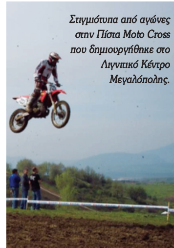
Στιγμιότυπα από αγώνες στην Πίστα Moto Cross που δημιουργήθηκε στο Λιγνικό Κέντρο Μεγαλόπολης.

τίωση των περιβαλλοντικών της επιδόσεων η ΔΕΗ εφαρμόζει Συστήματα Περιβαλλοντικής Διαχείρισης τα οποία πιστοποιεί σταδιακά και υλοποιεί εξειδικευμένες μελέτες βελτίωσης και αξιοποίησης των νέων εδαφών.