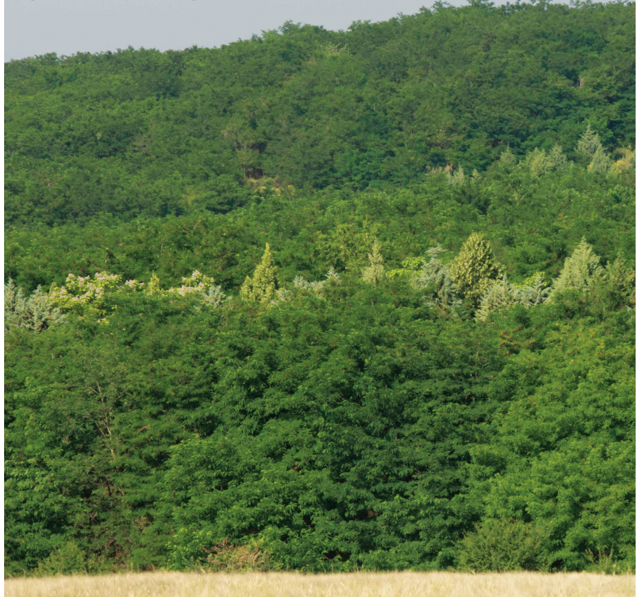
Αποψη αποκατεστημένης εξωτερικής απόθεσης του Ορυχείου Αμυνταίου στο Λιγνιτικό Κέντρο Δυτικής Μακεδονίας

Τα εφαρμοζόμενα προγράμματα αποκατάστασης μετά την ολοκλήρωση της δραστηριότητας εξόρυξης του λιγνίτη στοχεύουν στην εναρμόνιση της περιοχής με το φυσικό περιβάλλον και περιλαμβάνουν δενδροφυτεύσεις για τη δημιουργία εκτάσεων δασικής βλάστησης, δημιουργία καλλιεργήσιμων εκτάσεων για αγροτική χρήση, δημιουργία τεχνητών λιμνών για χρήσεις αναψυχής, επιπρόσθετα έργα για ειδικές χρήσεις όπως αθλητικά κέντρα, πάρκα αναψυχής, πίστες μηχανοκίνητου αθλητισμού κ.α. Με στόχο τη συνεχή βελ-