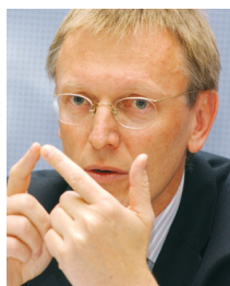
Ο Επίτροπος Περιβάλλοντος Janez Potocnik

Η Ευρωπαϊκή Επιτροπή αναλαμβάνει δράση για την ευαισθητοποίηση του κοινού σχετικά με αυτό το παγκόσμιο πρόβλημα, σύμφωνα με τις δεσμεύσεις που αναλήφθηκαν στο Ρίο εφέτος το καλοκαίρι, ώστε να μειωθεί η συχνότητα και οι επιπτώσεις της ρύπανσης αυτού του είδους στα θαλάσσια οικοσυστήματα.