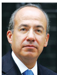
Ο πρώην πρόεδρος του Μεξικού Φελίπε Καλντερόν

Ιδιαίτερη αναφορά γίνεται επίσης στην έκρηξη του παγκοσμίου πληθυσμού κατά 2 δισ. ανθρώπους, στα 9 δισ. ως το 2050 και στην ανάγκη μετάβασης σε μια αειφόρο οικονομία προκειμένου ο πλανήτης να μπορέ-