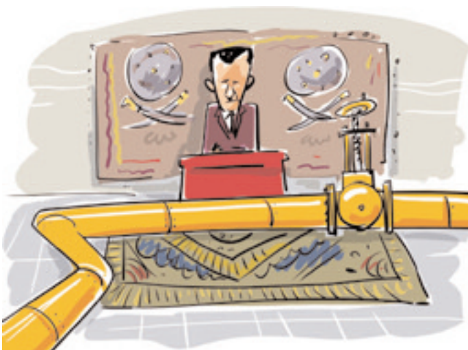
Εικόνα του Αλεξέι Γόρς

Κάτω από αυτές τις συνθήκες, η κρίση στη Μέση Ανατολή θα