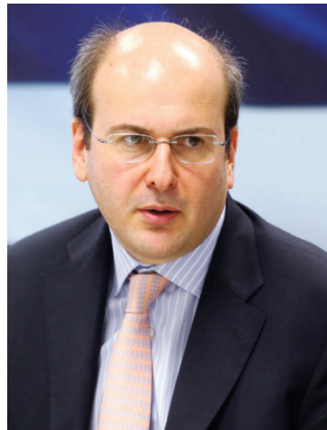
Ο Υπουργός Ανάπτυξης, Ανταγωνιστικότητας, Υποδομών, Μεταφορών και Δικτύων Κωστίς Χατζηδάκης

• Δημιουργείται άμεσα μια Κεντρική Αδειοδοτική Αρχή για τις Στρατηγικές και Ιδιωτικές Επενδύσεις, μέσω του σχετικού νομοσχεδίου που κατατίθεται για την αντιμετώπιση της γραφειοκρατίας και τη διευκόλυνση των επενδύσεων. Παράλληλα, παρακολουθούνται ενεργά, 51 επενδυτικά σχέδια: τα έντεκα εξ αυτών ύψους 7 δις ευρώ έχουν υπαχθεί στις διατάξεις στο Fast Track . Και επίσης, δεκαεννέα έργα