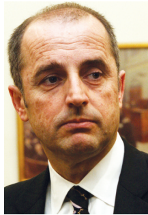
Ο κ. Χ. Σαχίνης Πρόεδρος ΔΕΠΑ

Ήδη αυτή τη στιγμή ο σταθμός υγροποιημένου φυσικού αερίου στη Ν. Ελλάδα, με συνολική χωρητικότητα περίπου 135.000 κυβικά μέτρα LNG, ο οποίος όμως, μπορεί να καλύψει τις ανάγκες της χώρας για πε-