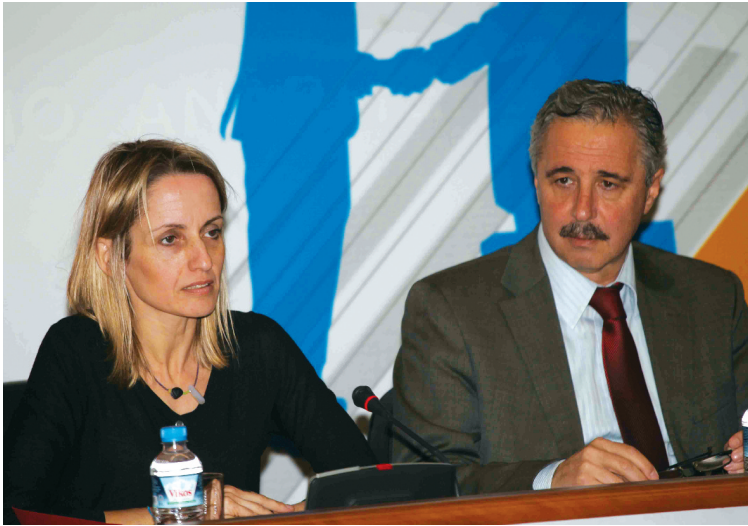
Η υπουργός Περιβάλλοντος Τ. Μιρμιλή με τον υφυπουργό κ. Γ. Μανιάτη

Τη συγκρότηση επιτροπής για τον Εθνικό Ενεργειακό Σχεδιασμό ανακοίνωσε η Κυβέρνηση, ταυτόχρονα έγινε γνωστό ότι προωθείται η διαδικασία για την δημιουργία ενιαίου φορέα για την αναζήτηση και αξιοποίηση πετρελαίου.