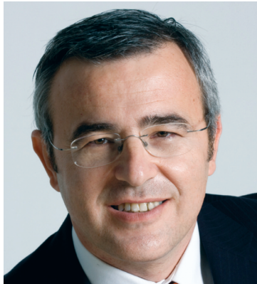
Του Ν. Κανελλόπουλου Προέδρου ΕΟΤ

Το φαινόμενο “τουρισμός” χτίζεται κυρίως με τη χρήση φυσικών και ανθρωπογενών πόρων, οι οποίοι είναι και οι κύριοι αποδέκτες των θετικών ή αρνητικών επιρροών, που αυτός επιφέρει. Άλλωστε, η σχέση τουρισμός-περιβάλλον αποτελεί ένα κεντρικό ζήτημα πολιτικής, τόσο από την πλευρά της τουριστικής ανάπτυξης, όσο και από την πλευρά προστασίας των πολιτιστικών και φυσικών πόρων μιας περιοχής.