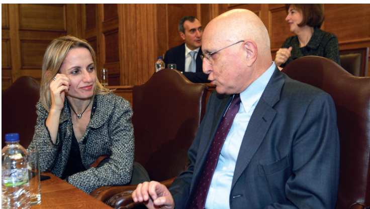
Η υπουργός Περιβάλλοντος Τ. Μπιρμπιλίη και ο Επίτροπος για το περιβάλλον Στ. Δήμας

Σε συζήτηση που έγινε στο Συμβούλιο Υπουργών Περιβάλλοντος για την προετοιμασία και του Ευρωπαϊκού Συμβουλίου, το οποίο θα προηγηθεί της Κοπεγχάγης, με την παρέμβασή μας πετύχαμε σε ένα βαθμό να δώσουμε επιχειρήματα και στις χώρες που υποστηρίζουν τις μεγάλες και δραστικές μειώσεις και τις αλλαγές σε ευρωπαϊκό επίπεδο. Επίσης σε επίπεδο Πρωθυπουργού θα υπάρξει μία πρωτοβουλία για τις χώρες της Μεσογείου, ώστε μετά την Κοπεγχάγη να