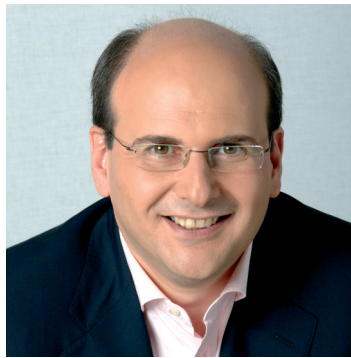
Ο υπουργός Ανάπτυξης Κωστής Χατζηδάκης

Την εφαρμογή «πράσινης επιχειρηματικότητας» προτείνει πλέον και η Κυβέρνηση στον τομέα της ανάπτυξης.