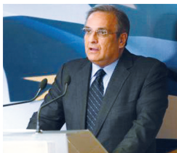
Ο κ. Γ. Παπαθανασίου υπ. Οικονομίας και Οικονομικών

σεις αυξήθηκαν το εννεάμηνο του έτους κατά 61,9% σε σχέση με την αντίστοιχη περίοδο του 2007 και έφτασαν στα €1,8δισ. Η διείσδυση στις ΜΜΕ αναμένεται να ενισχυθεί το 2009 μέσω της δυναμικής συμμετοχής της ΑΤΕbank στο πρόγραμμα του ΤΕΜΠΜΕ.