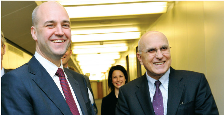
Ο Επίτροπος κ. Σταύρος Δήμας υποδέχεται τον Σουηδό Πρωθυπουργό, κ. Φρέντρικ Ραϊνφελντ

Η οικονομική κρίση δεν μπορεί να αποτελέσει λόγο αναβολής της ανάληψης δράσης για την αντιμετώπιση της αλλαγής του κλίματος.