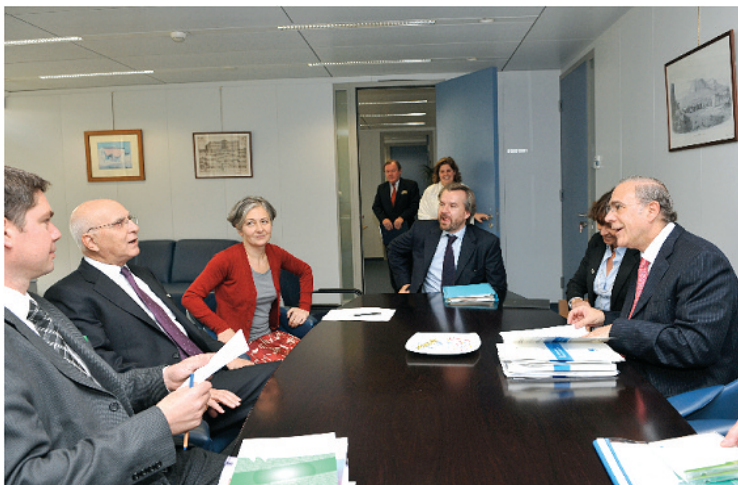
Σημείο από την συνάντηση του Επιτρόπου Στ. Δήμα με τον κ. Jose Angel Gurria Τρενίθο (Γεν. Γραμματέα του ΟΟΣΑ) για να συζητήσουν θέματα που αφορούν τις οικονομικές επιπτώσεις των κλιματικών αλλαγών.

Η Επίτευξη συμβιβαστικής λύσης επί της θέσης για την ενέργεια και το