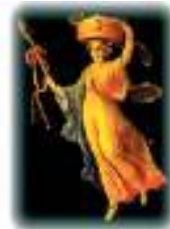
Τοιχογραφία με παράσταση Βάκχης με τον θύρο από το Μέγαρο Σερπιέρη που στεγάζεται η ΑΤΕbank

Εξασφαλίζει κερδοφορία για τους μετόχους της, και δημιουργεί πραγματικές αξίες συμβάλλοντας στην οικονομική ανάπτυξη, την