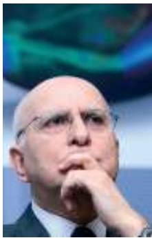
Ο Επίτροπος, Σταύρος Δίμας αρμόδιος για το περιβάλλον

Με την οδηγία για την περιβαλλοντική ευθύνη θεοπίστηκε νομικό πλαίσιο για την ευθύνη σε περίπτωση ζημίας στο περιβάλλον, το οποίο βασίζεται στην αρχή "ο ρυπαίνων πληρώνει" και αποσκοπεί στην πρόληψη και την αποκατάσταση των περιβαλλοντικών ζημιών. Τα φυσικά και νομικά πρόσωπα που ασκούν ή ελέγχουν δραστηριότητες οι οποίες απαριθμούνται στην οδηγία είναι απολύτως υπεύθυνα για τις ζημιές που προκαλούν στο περιβάλλον μέσω της δραστηριότητάς τους. Οι καλυπτόμενες περιβαλλοντικές ζημιές είναι εκείνες που προκαλούνται σε προστατευόμενα είδη κλωρίδας και πανίδας ή φυσικά ενδιαίτηματα, στα ύδατα και στο έδαφος. Την 1η Ιουνίου 2007, η Επιτροπή απέστειλε μια πρώτη γραπτή προειδοποίηση σε 23 κράτη μέλη που τότε δεν είχαν ακόμη ενσωματώσει την οδηγία, αλλά μόνο 14 από αυτά εκπλήρωσαν την υποχρέωσή τους στο διάστημα που μεσολάβησε.