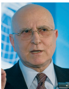
Ο κ. Σταύρος Δήμας, Επίτροπος Περιβάλλοντος Ε.Ε.

Η Ε.Ε. αναμένεται να ασκήσει πίεση για να συνεχισθεί η πρόοδος, με τις επίσημες διαπραγματεύσεις ενόψει της κατάρτισης της νέας συμφωνίας των Ηνωμένων Εθνών για την κλιματική αλλαγή. Οι συσκέψεις σηματοδοτούν την πρώτη σύνοδο διαπραγματεύσεων από τότε που η Διάσκεψη των Ηνωμένων Εθνών για το κλίμα στο Μπαλί, τον περασμένο Δεκέμβριο, αποφάσισε να