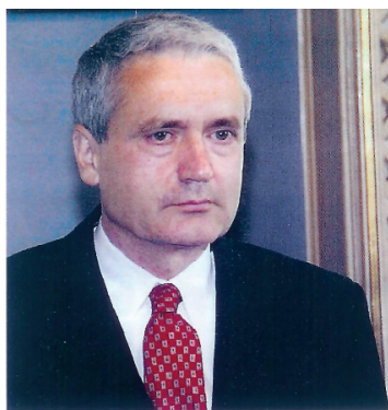
Ο πρόεδρος της ΑΤΕ Δ. Μηλιάκος

Ο αντίκτυπος αυτών των πρωτόγνωρων εξελίξεων, επισήμανε χαρακτηρισικά στην ομιλία του ο διοικητής της Αγροτικής Τράπεζας Δημήτρης Μηλιάκος αποτελεί ένα σημαντικό πεδίο προβληματισμού και για το Τραπεζικό χώρο και μεταξύ άλλων υπογράμμισε: Ξεκινώντας από την παγκόσμια οικονομία, κατά την προσεχή εικο-